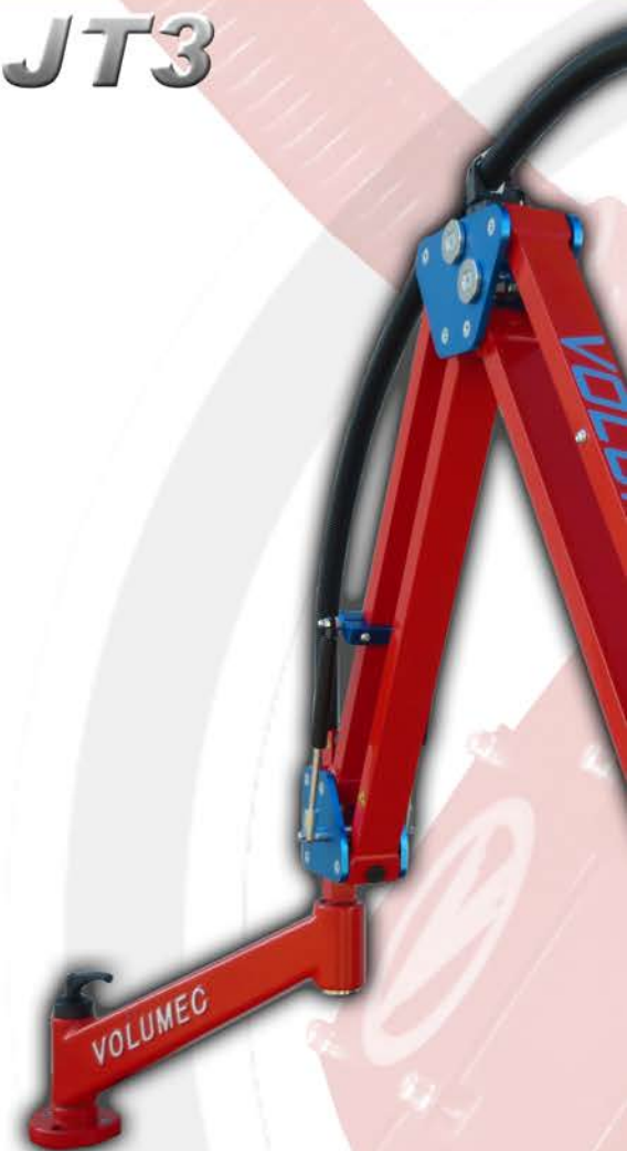
TRIPLO BRACCIO ARTICOLATO JT3 RAGGIO DI LAVORO 1900 mm