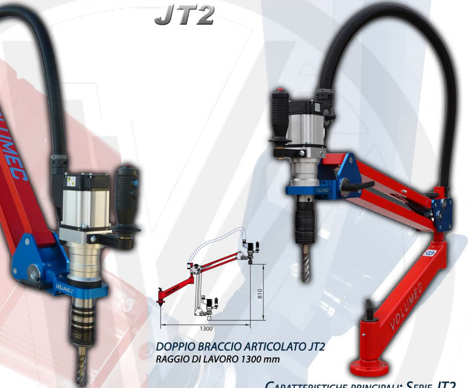
DOPPIO BRACCIO ARTICOLATO JT2 RAGGIO DI LAVORO 1300 mm